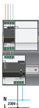
Schéma de câblage