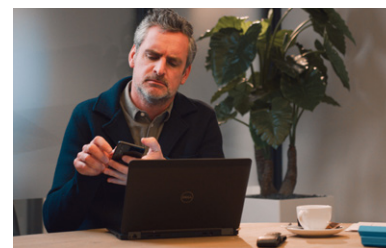
Rörelsedetektering vid dina föräldrars hus