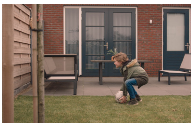
Rörelsedetektering vid din ytterdörr