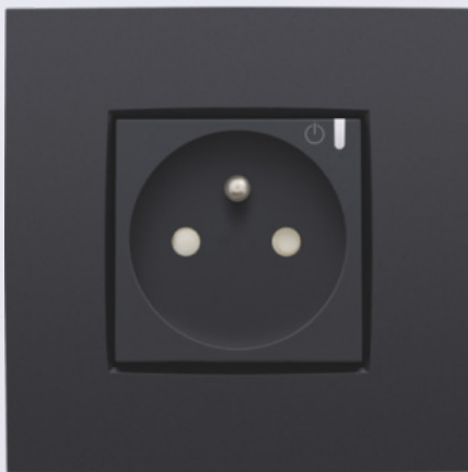
Geconnecteerd schakelbaar stopcontact

De solar mode van Niko Home Control zorgt ervoor dat geconnecteerde toestellen automatisch geactiveerd worden wanneer er te veel zonne-energie wordt opgewekt. Met een aantal huishoudelijke producten die veel energie verbruiken - denk aan je boiler, wasmachine en je droogkast - is het voordeliger dan ooit om de gratis energie die je produceert, te gebruiken wanneer die beschikbaar is. Niko Home Control kan je helpen met het beheer van je apparaten op basis van je zelf opgewekte energie, waardoor jouw zelfconsumptie verhoogd wordt en jouw distributiekosten (goed voor zo'n 45% van je energiefactuur)* worden teruggeschoefd. Dat kan je bijvoorbeeld doen met geconnecteerde schakelbare stopcontacten of slimme stekkers die enkel geactiveerd worden wanneer er zonne-energie beschikbaar is.