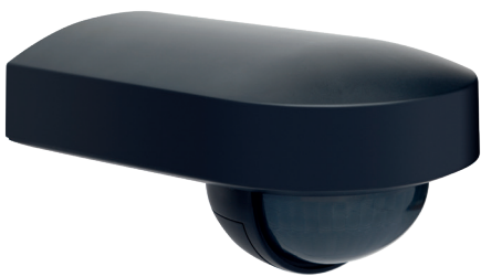
Portée de détection