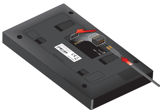
Schéma de câblage